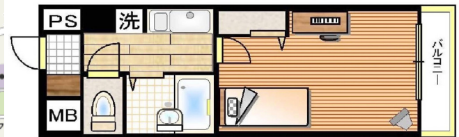
略図につき現状優先とします。

☆☆最寄り駅からマンションまで☆☆ 新大阪東出口を出て、新大阪東口ビル、 新大阪丸ビル方面へ。ホテルアネックスの角 を曲がり、2軒目です。